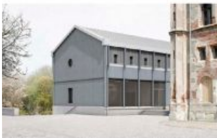
Externe Facadierung der „Neuen Remise“ (Architekt: Werner Tschudi, Berlin/Brandenburgische Technische Universität Berlin)